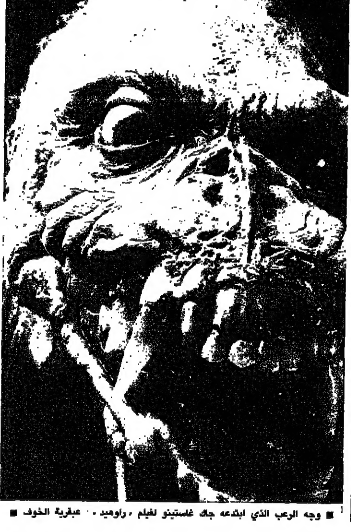
وجه الرب الذي ابتدعه جاك غاستينو لفيلم راوليد. عبقرية الخوف